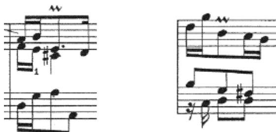
Ej.5.- Fuga BWV 856 , J.S. Bach, cc. 45 y 55 (cadencias)

A partir del compás 56 encontramos el divertimento 2 , de unos diez compases de duración, con un motivo modulante que recuerda a la progresión del primero, igualmente descendente que a partir del compás 60 se intensifica a raíz de sus propios elementos (corcheas en las dos voces superiores y el motivo de semicorcheas en el bajo que proviene claramente del final del contrasujeto) ( vid. Ejemplo 6 y ejemplo 2 -correspondiente al contrasujeto- para comparar ambos motivos).