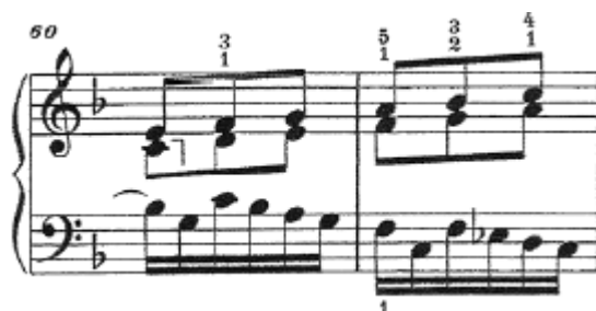
Ej.6.- Fuga BWV 856 , J.S. Bach, cc. 60 y 61

A partir del compás 56 encontramos el divertimento 2 , de unos diez compases de duración, con un motivo modulante que recuerda a la progresión del primero, igualmente descendente que a partir del compás 60 se intensifica a raíz de sus propios elementos (corcheas en las dos voces superiores y el motivo de semicorcheas en el bajo que proviene claramente del final del contrasujeto) ( vid. Ejemplo 6 y ejemplo 2 -correspondiente al contrasujeto- para comparar ambos motivos).