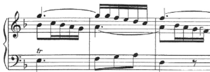
Ej.4.-Fuga BWV 856, J.S. Bach, cc. 30-32

alternativamente el motivo de semicorcheas que sirve de cierre al sujeto y al contrasujeto. La voz grave (el bajo) interviene con un motivo ascendente que podría justificarse como la cabeza del sujeto invertido. Esta progresión modulante nos conduce a Re menor ( vid. Ejemplo 4).