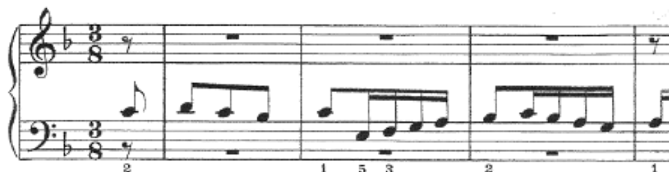
Ej.1.-Fuga BWV 856, J.S. Bach, cc. 0-4

El sujeto de la fuga ocupa cuatro compases, con un ritmo marcadamente regular ( vid. Ejemplo 1).