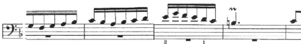
Ej. 2.-Fuga BWV 856, J.S. Bach, cc. 4-8

La voz media (de alto) que antes había expuesto el sujeto, pasa a dibujar el contrasujeto , que ocupa prácticamente cinco compases ( vid. Ejemplo 2).